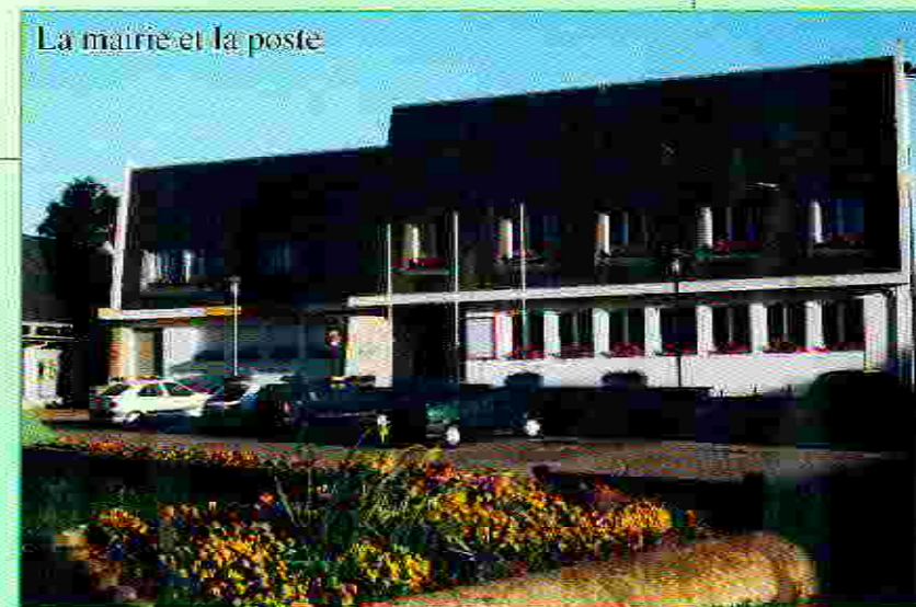
La mairie et la poste