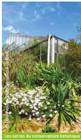
Les serres du conservatoire botanique

Conservatoire botanique national à Brest - Toute l'année Une arche pour sauver les plantes ! Ce jardin remarquable de 30 hectares vous invite à la découverte de la biodiversité végétale. Serres tropicales et expos. 02 98 41 88 95