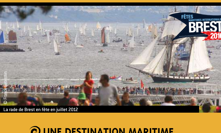
La rade de Brest en fête en juillet 2012