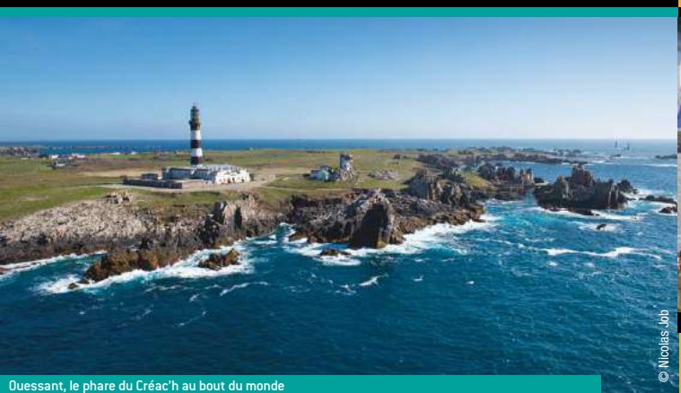
Ouessant, le phare du Créac'h au bout du monde

Partez à la découverte de Brest terres océanes, destination maritime par excellence. Brest, port des records, donne sur la plus grande rade d'Europe, praticable toute l'année pour les activités nautiques. Plein ouest, l'Iroise et ses îles sont à l'origine du premier parc naturel marin français. Au sud de la rade, sillonnez la presqu'île de Crozon, ses falaises escarpées et ses pointes spectaculaires. Et sur la côte nord, serpeztez entre les abers pour atteindre les plages de sable blanc de la côte des légendes et ses chaos rocheux.