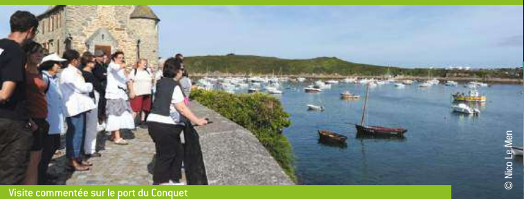
Visite commentée sur le port du Conquet

Fort de Bertheaume à Plougonvelin - Été Prenez l'assaut de cette forteresse de Vauban par la via ferrata, la tyrolienne ou plus sagement à pied par la passerelle. Spectacles et visites théâtralisées. 02 98 48 30 18