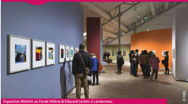
Exposition Mattotti au Fonds Hélène & Édouard Leclerc à Landerneau