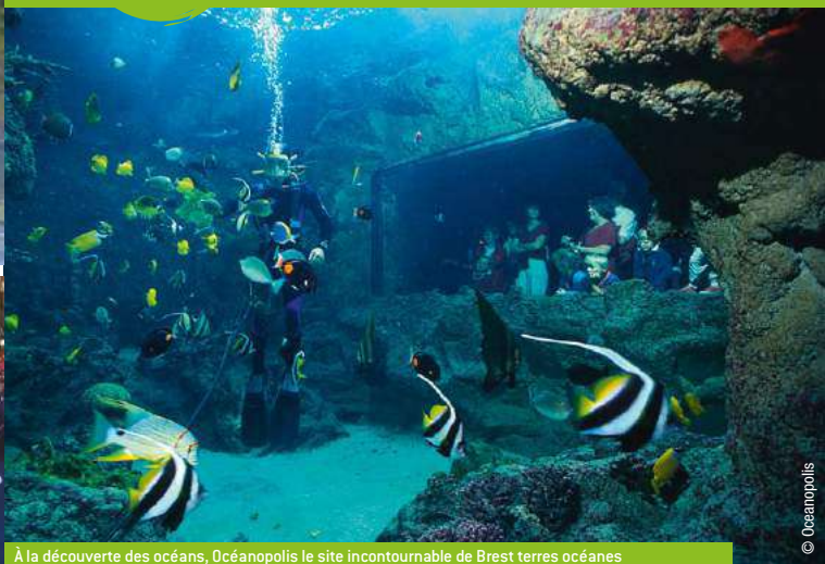
À la découverte des océans, Océanopolis le site incontournable de Brest terres océanes

Les familles plébiscitent Brest terres océanes pour ses lieux de visites et d'attractions uniques. Au choix selon vos envies : un tête à tête avec un phoque, une balade au cœur de serres tropicales, une "murder party" dans un château, des sensations plus que fortes sur un grand huit, une visite théâtralisée en costumes dans un fort Vauban... On ne sait que choisir !