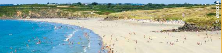
Plage des Blancs-sablons au Conquet

Ici chacun son style de plages : les très longues au sable blanc, les plus intimistes entre falaises découpées, les familiales aux éclats de rire d'enfants et les paradisiaques aux couleurs turquoises. Les activités nautiques ne manquent pas et les plans d'eau non plus ! Vous opterez pour une balade à bord d'un catamaran, d'un voilier du patrimoine ou de la Recouvrance, goëlette ambassadrice de Brest. À moins qu'une pratique plus sportive vous tente ? en prenant des cours ou en louant du matériel dans un Spot Nautique ou dans un centre nautique. Pour les plaisanciers, 5 ports de plaisance et de nombreux petits ports proposent des mouillages ou pontons.