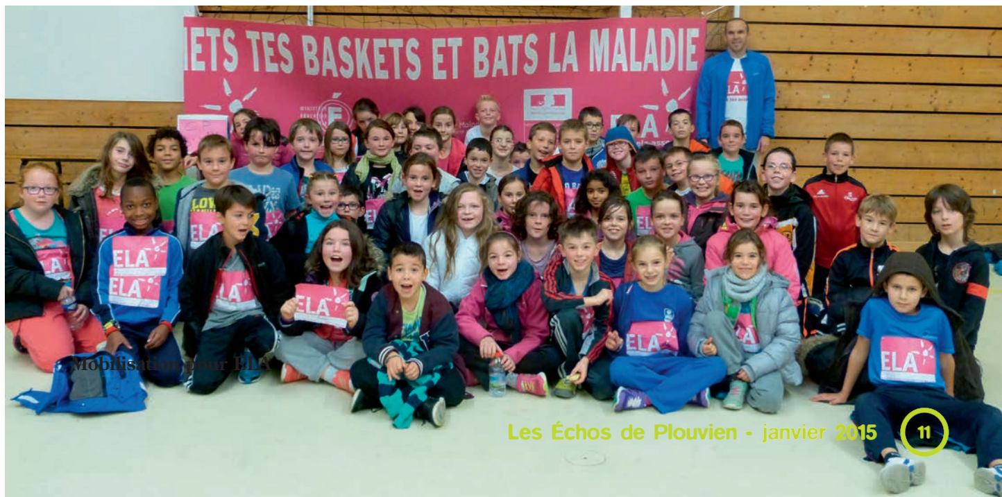
Mobilisation pour ELA

Trois commerçants se sont unis pour offrir aux enfants et aux habitants de Plouvien des promenades en calèche, et différentes attractions.