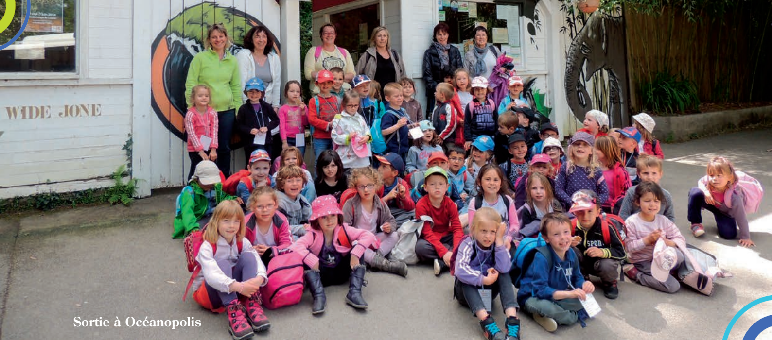
Sortie à Océanopolis