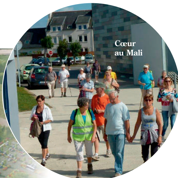
Cœur au Mali

Une entreprise de solidarité maintenant bien rôdée : Cœur au Mali mobilise randonneurs et bénévoles. 4 420 euros sont récoltés grâce à la participation de plus de 1000 personnes.