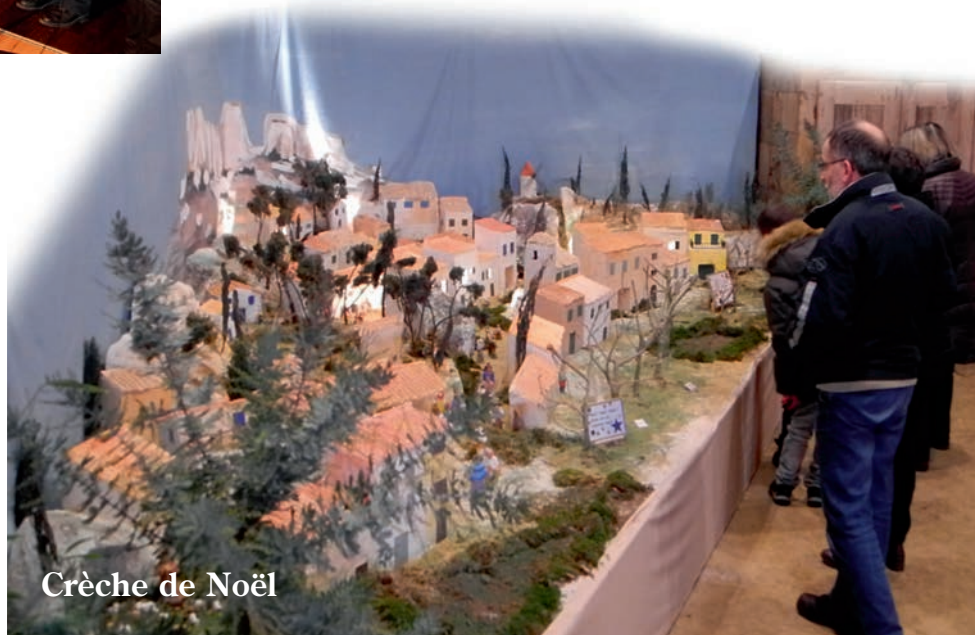
Crèche de Noël

L'ASP sait y faire : un bon encadrement et aucun carton rouge lors de la dernière saison. Ce trophée qualité foot est largement mérité car il récompense les clubs les plus actifs dans l'amélioration des structures, de l'encadrement et du comportement.