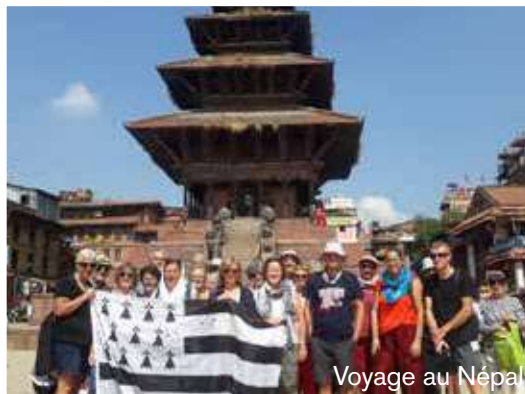
Voyage au Népal