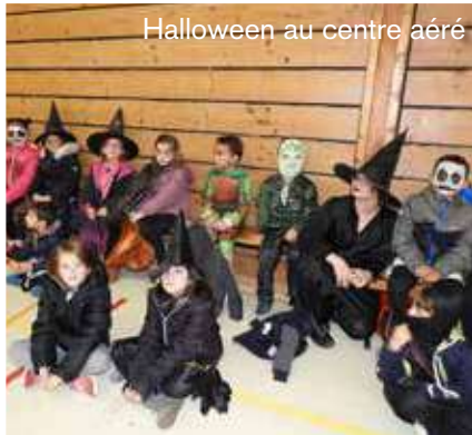
Halloween au centre aéré