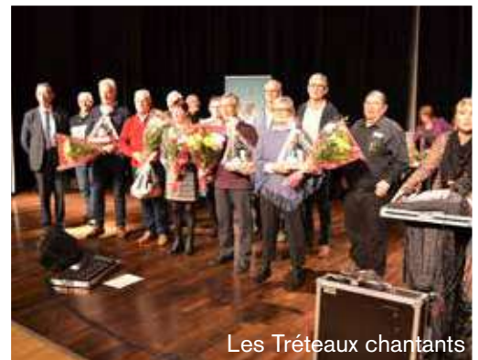
Les Tréteaux chantants