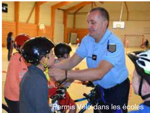
Permis Vélo dans les écoles