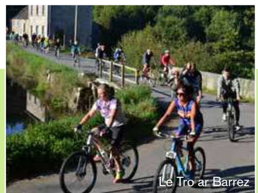
Le Tro ar Barrez