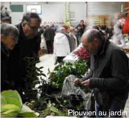
Plouvien au jardin