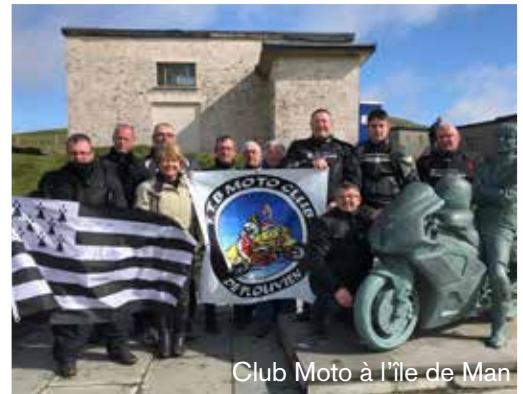
Club Moto à l'île de Man