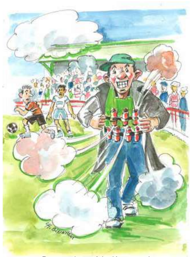
Des matchs parfois détonnants !

Les U15 participent au Festival d'Armor (Plougonvelin) et affrontent le PSG en huitième de finale. Si Mbappé et Neymar Jr. ne sont pas venus encourager les espoirs du camp des loges, nos futurs séniors se sont régalez pour