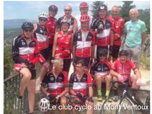
Le club cyclo au Mont Ventoux