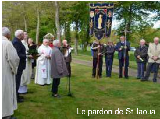
Le pardon de St Jaoua