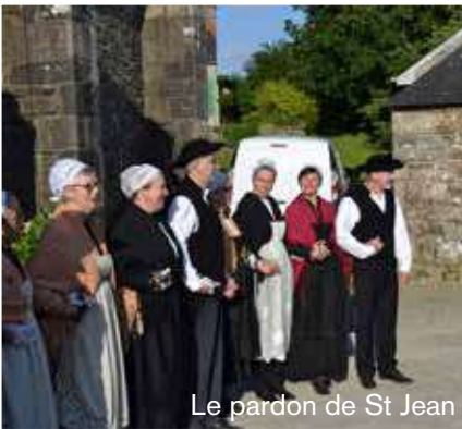
Le pardon de St Jean