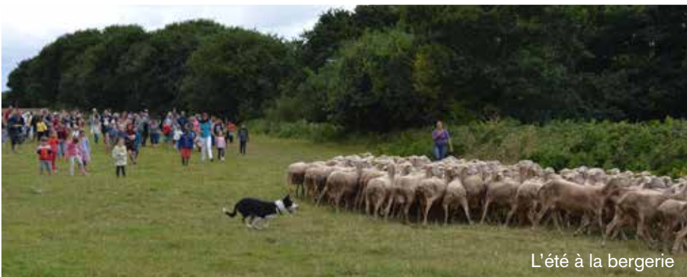
L'été à la bergerie